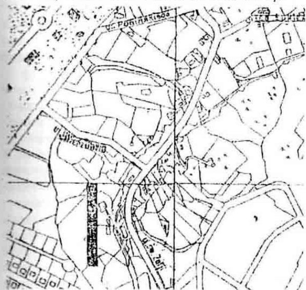
Рис. 4. Проектована ділянка станом на 1931 р.

На початку XX ст. територія та околиці мастку Красучина, що знаходився на південь від Софіївки, завдяки мальовничому розташуванню та здоровому клімату, привернули увагу львівських архітекторів, які планували продовжити тут реалізацію популярної на той час у Львові урбаністичної концепції міста-саду, яку так і не вдалося завершити арх. І. Левинським і Ю. Захарієвичем.